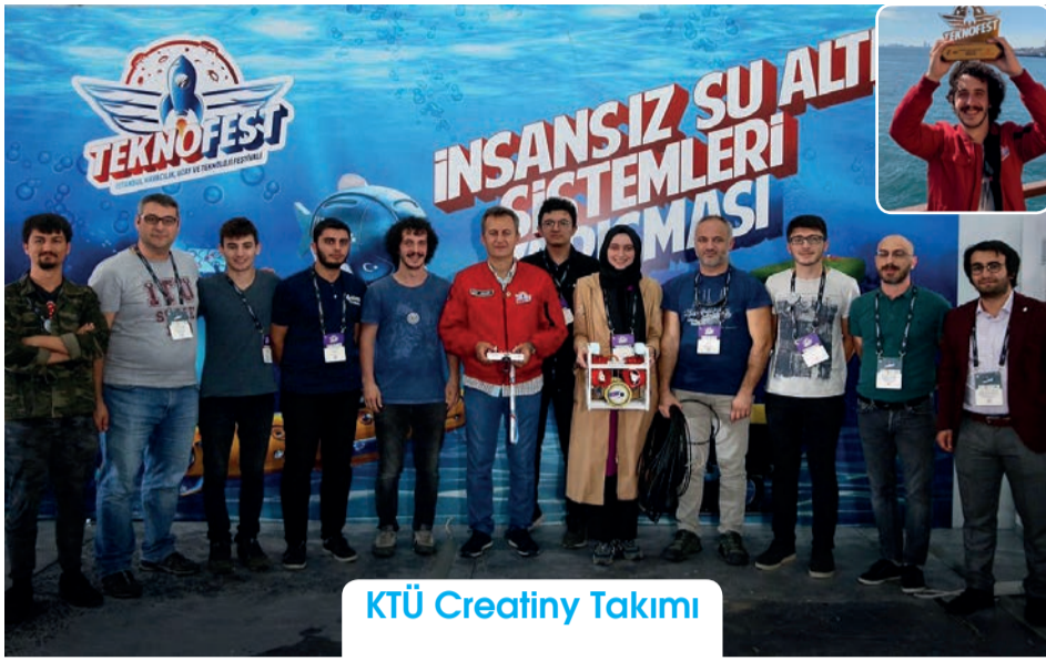
KTÜ Creatiny Takımı

Bu yıl ikincisi düzenlenen TEKNOFEST Havacılık, Uzay ve Teknoloji festivalinde üniversitemiz Creatiny Takımı, İnsansız Su Altı Sistemleri Yarışmasında ileri kategoride birincilik elde etti.