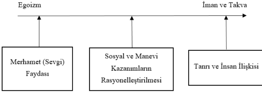
Şekil 1: İslami Tüketim Sisteminde Özgeçlilik Modeli

Farklı seviyelerden oluşan bu modele göre en düşük seviye egoizmdir. Tüketiciler etrafındaki kimseye ve sosyal çevresine herhangi bir yardımda bulunmamaktadır. Yani modeldeki okun yönü sola doğru gittikçe kişinin bencillik seviyesi artmakta, sağa doğru gittikçe ise kişinin takvası artmaktadır. Bu egoizm ile takva arasında yer alan özgeçlilik seviyesi üç aşamada ifade edilmektedir. İlki merhamet ve sevgi faydasıdır. Kişi duygusal değerlerinden dolayı fayda sağlamaktadır. Zaten kişi doğası gereği doğaya ve diğer canlılara merhamet ve sevgi beslemektedir. Bu ruhu ortaya çıkarmak merhamet ve sevgi duygusunu da ortaya çıkaracaktır. Örneğin, doğal afetlerde yapılan gıda ve tıbbi yardımlar, bir adamın sevdiği kadının seyahat masraflarını karşılaması, bir yöneticinin çalışanlarının tıbbi giderlerini karşılaması gibi tutumlar bu fayda türüne ilişkindir.